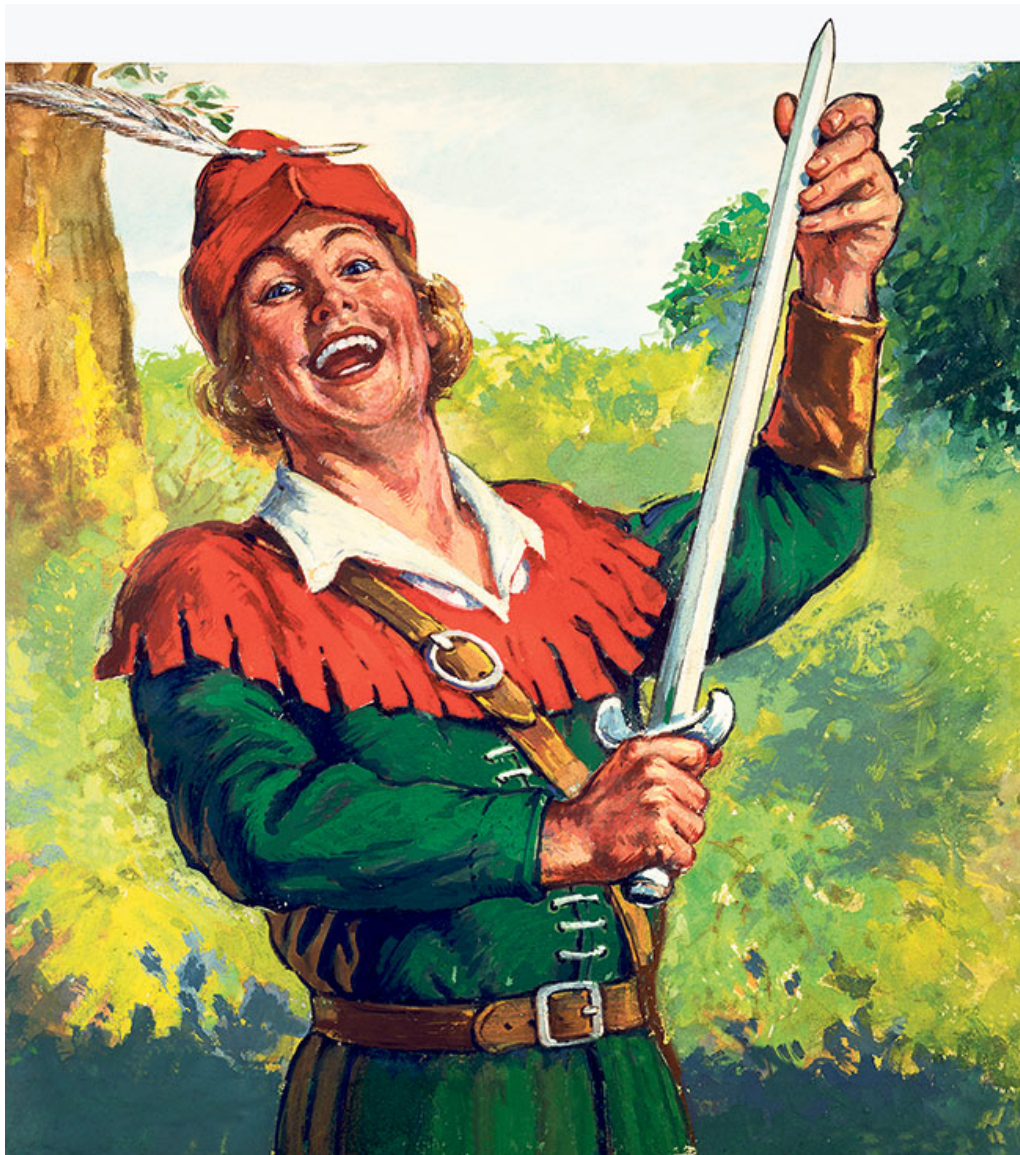
Anonyme. – « Robin des bois » Look and Learn - Bridgeman Images